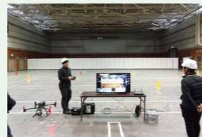
講師によるデモフライト