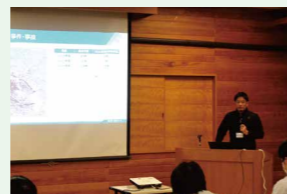
ドローン安全基礎講習(座学のみ)