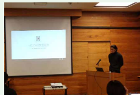
初心者体験講習(座学)